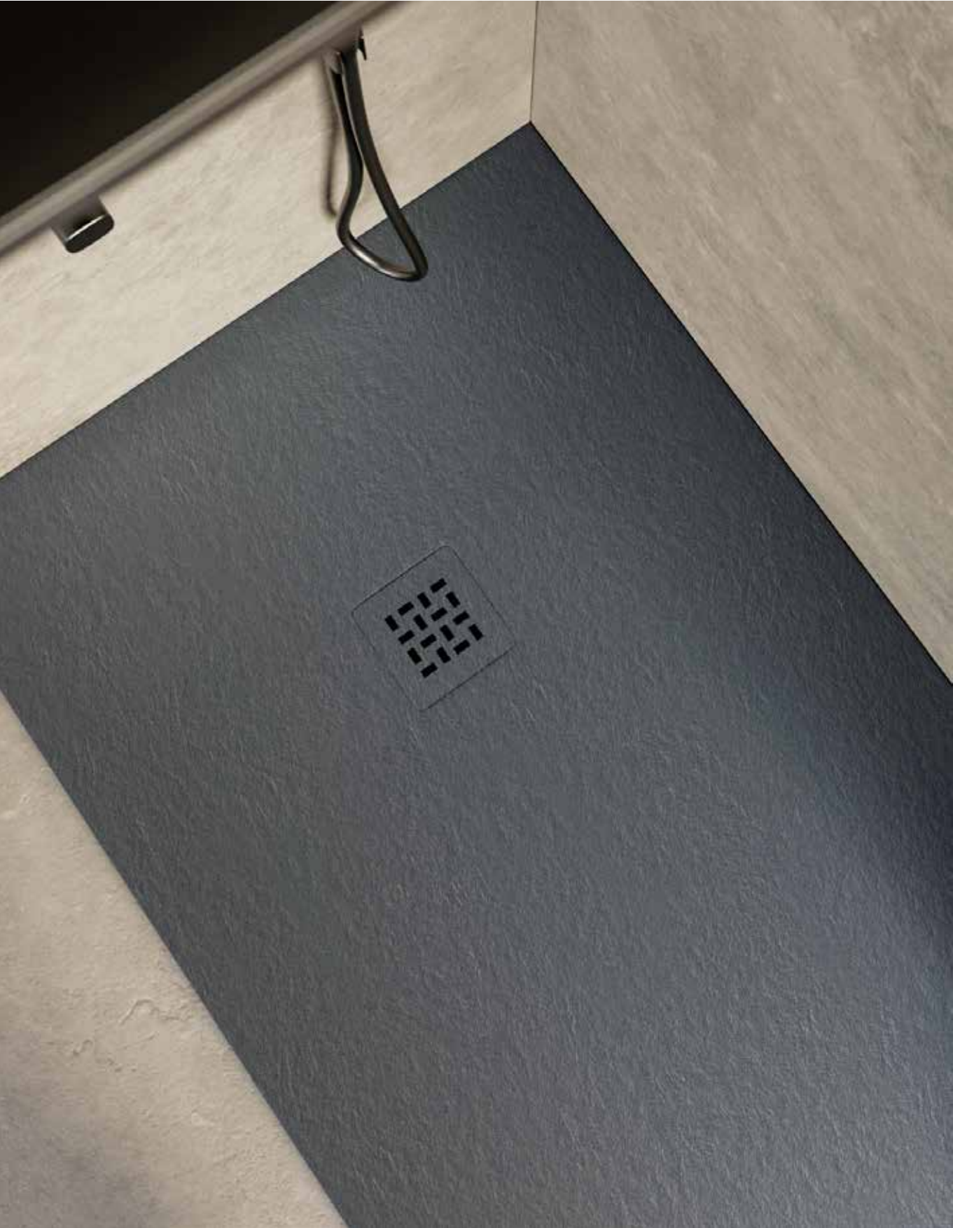
Personalizable y adaptable en ancho y largo. También admite recortes.